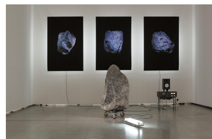
Samuel Schaab | Search Face I - III | 2017 | Lightsculptur: Fine Art print, Neonlights,