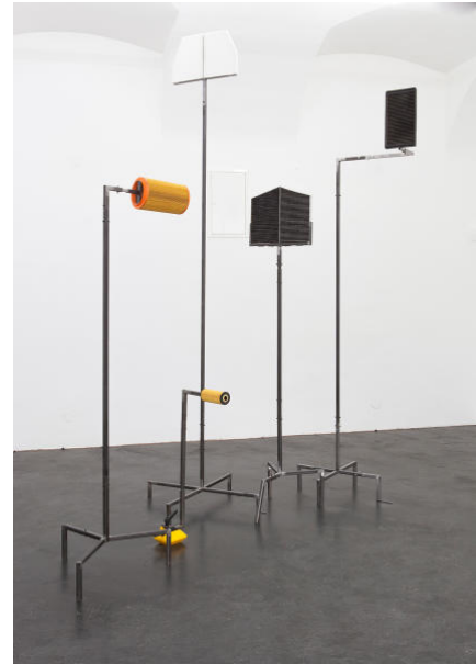
Samuel Schaab | dust tape voice | 2018 | Installation | Exhibition view: Memphis Linz