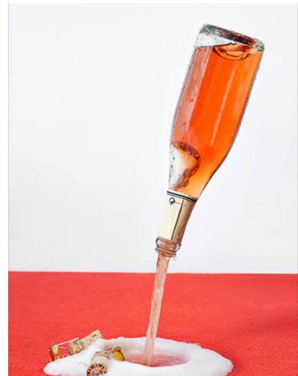
Alwin Lay | Glückwunsch / Congrats | 2010 | Pigment Print | Print: 28 x 34 cm, Frame: 28 x 34 cm | Edition 5/30